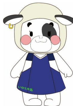
引佐南部中学校 マスコットキャラクター 『ゆきちゃん』